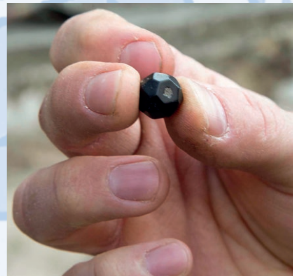
Ausgrabungs- und Fundstelle

Etwa seit dem ausgehenden 12. Jahrhundert gruppierte sich hier ein kleiner Ring niedriger Häuser um eine kleine Kirche aus dem späten 11. Jahrhundert. Der Straßennamen „Rundhöfchen“ erinnert an die Bebauung des mittelalterlichen Dorfes.