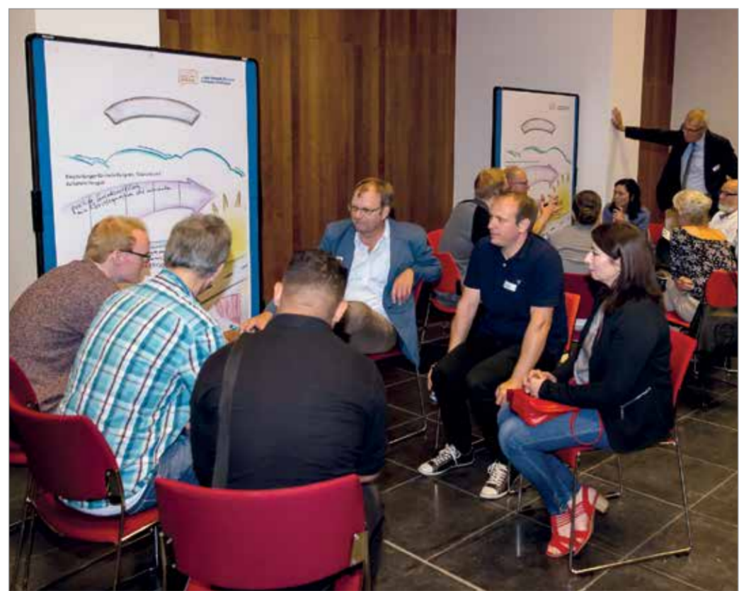
Die Teilnehmerinnen und Teilnehmer im Austausch miteinander.

Aber auch für sich selbst identifizierten die Bürgerinnen und Bürger Handlungsfelder: selbst Toleranz und Respekt gegenüber denjenigen zeigen, von denen man diese Wertschätzung erfahren möchte, und mehr soziale Verantwortung gegenüber den Mitbürgerinnen und Mitbürgern übernehmen. Derzeit prüft die Stadt Möglichkeiten der Umsetzung. Wichtigstes Ergebnis war jedoch: Das Format kam so gut an, dass es auf jeden Fall fortgesetzt wird.