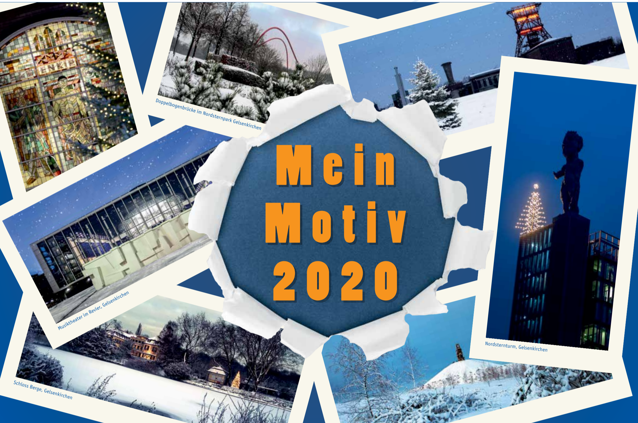
Doppelbogenbrücke im Nordsternpark Gelsenkirchen