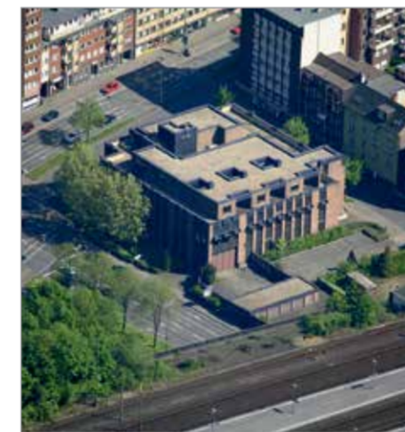
Die Fahrzeug-Zulassungsstelle an der Wildenbruchstraße.

„Die Umstellung auf die ausschließliche Terminvergabe ist aber nur ein Baustein von vielen, um die Situation in der Fahrzeug-Zulassungsstelle zu verbessern“, wie Marion Penquitt erklärt. So sollen in den nächsten Monaten zum Beispiel die Räume renoviert und die Beschilderung verbessert werden. Auch mehr Personal, um mehr Termine anbieten zu können, und ein Serviceschalter im Erdgeschoss gehören zu den weiteren Schritten. An diesem Schalter sollen die Mitarbeiterinnen und Mitarbeiter nicht nur Termine vergeben, sondern auch Unterlagen auf Vollständigkeit prüfen und beraten.