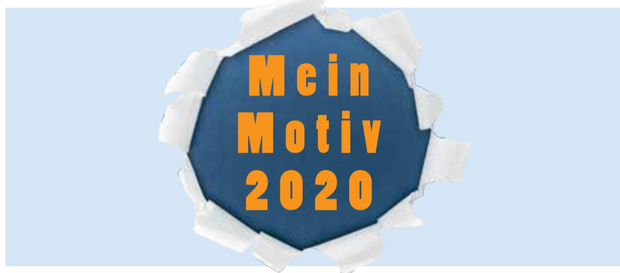
Foto-Wettbewerb für die Weihnachtskarte 2020