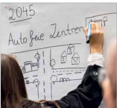
Visionen für die Mobilität der Zukunft in Gelsenkirchen.