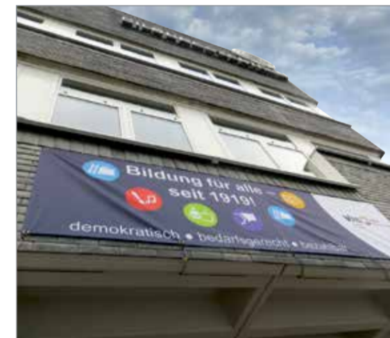
Die VHS befindet sich im Bildungszentrum in Gelsenkirchen.

„Willkommen bei Nasrins Welt“, lädt die Frau auf dem Monitor ein. Die 29-jährige aus Afghanistan stammende Frau möchte gemeinsam mit anderen Deutsch lernen. Doch Nasrin existiert nur virtuell. Per App oder auch im Web ist sie Teil des Lernportals der Volkshochschule (VHS).