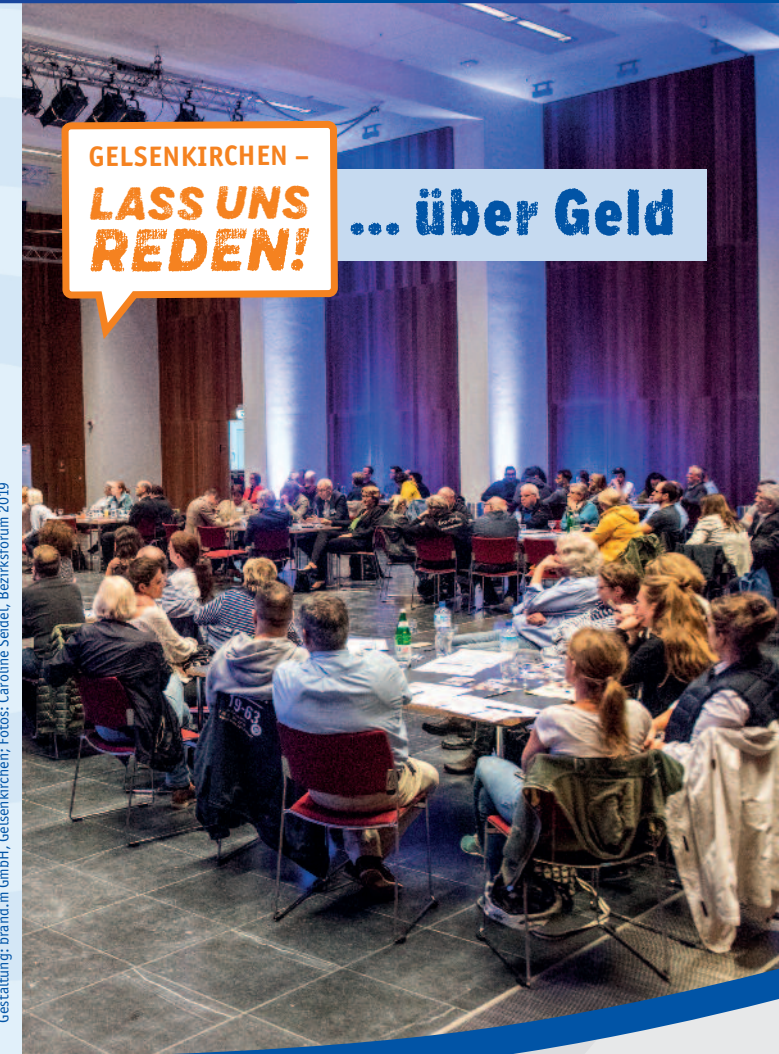
Gestaltung: brand.m GmbH, Gelsenkirchen, Bezirksforum 2019

Lesen Sie weitere Informationen im Internet auf den Seiten: www.gelsenkirchen.de/bezirksforum