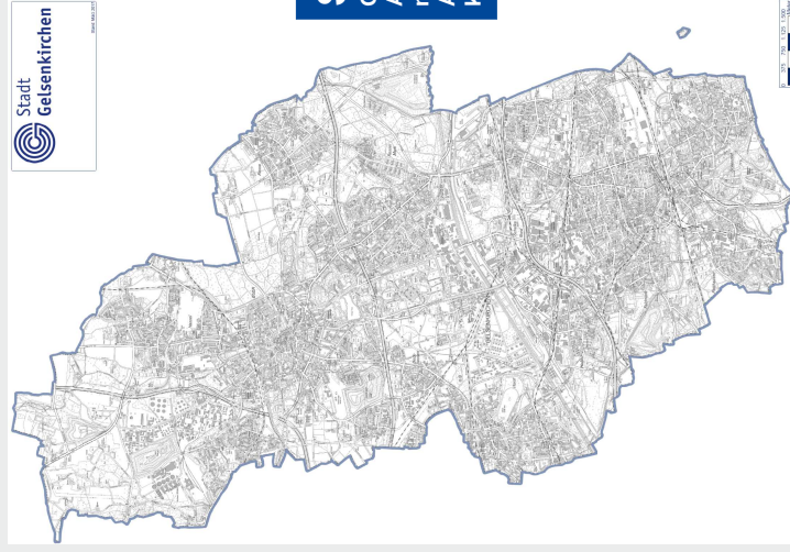
Ausgangssituation Stadtgebiet Gelsenkirchen