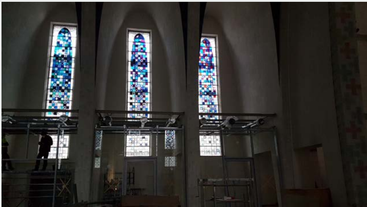
Erhaltung und Umbau fügen sich in der Lobby der Kirche zusammen.

Vor einem Jahr fiel der Startschuss für den Umbau der Heilig Kreuz-Kirche an der Bochumer Straße in Ückendorf. Seither laufen die Bauarbeiten auf Hochtouren, mit dem Ziel, aus einem der bedeutendsten Kirchenbauwerke der Moderne einen ebenso außergewöhnlichen Veranstaltungsort zu machen. Aus diesem Grunde bietet das Stadtteilbüro Bochumer Straße seit Februar 2020 öffentliche Baustellenführungen an. Sie starten mit einer Präsentation im Stadtteilbüro. Hier erhalten die Teilnehmerinnen und Teilnehmer einen Überblick über das Umbauprojekt Heilig Kreuz sowie Informationen über begleitende Maßnahmen der Stadterneuerung. Anschließend wird die Baustelle Heilig Kreuz besichtigt.