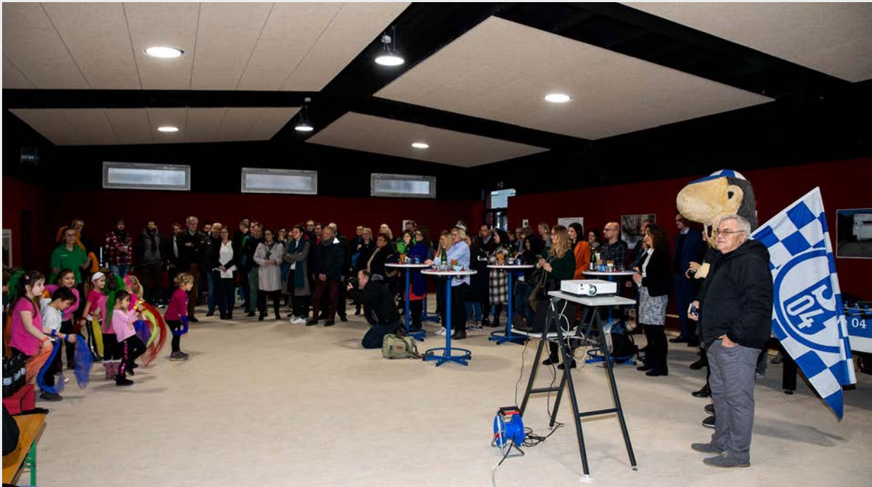
Eröffnungsfeier der Sportbude mit dem Schalker Maskottchen Erwin

Am 15. Januar 2020 wurde die neue „Sportbude“ im Hinterhof der Bochumer Straße 94 feierlich eröffnet. Die ehemalige Lagerhalle wurde von der SEG und der Stadt Gelsenkirchen modellhaft zu einem multifunktionalen Sport- und Bewegungsraum entwickelt, der insbesondere Kindern und Jugendlichen sowie den sozialen bzw. Bildungseinrichtungen im Quartier als Ort der Bewegungsförderung dienen soll, aber darüber hinaus auch der gesamten Bewohnerschaft offensteht.