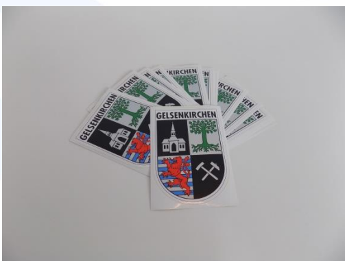
Aufkleber „Gelsenkirchen Wappen“