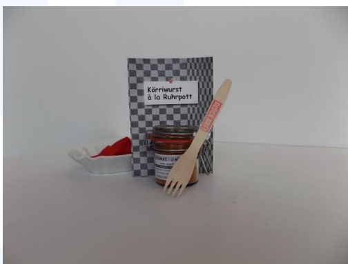
Nostalgie „Körriwurst Set“