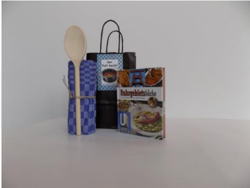
Nostalgie „Der Pott kocht“