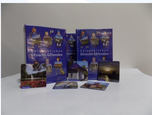
Memory „GESUCHT – Gefunden“