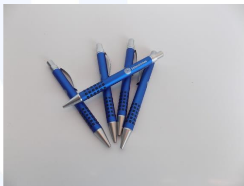
Kugelschreiber „Edition GE“