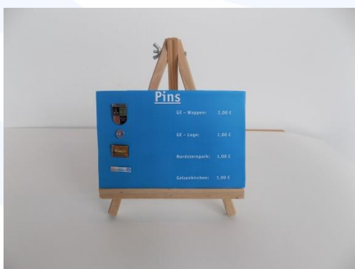
Pin „Edition GE“