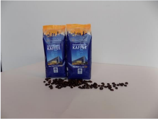
Kaffee Gelsenkirchen „Fairtrade“