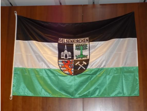
Hissfahne GE Wappen (100 x 150 cm)