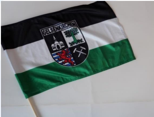
Schwenkfahne „GE Wappen“