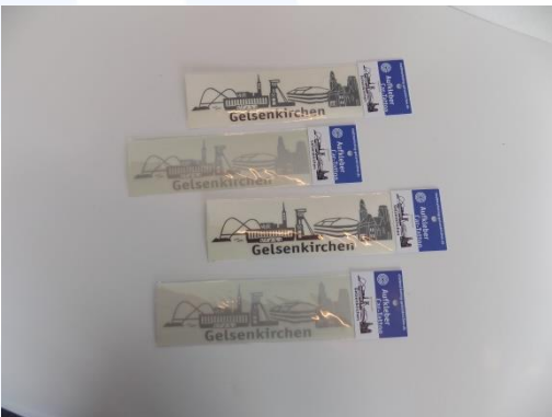
Aufkleber „Skyline Gelsenkirchen“