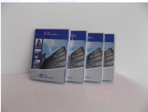
DVD „Das neue Hans Sachs Haus“