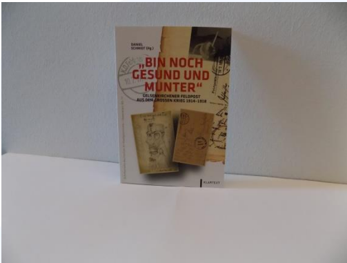
Buch „Bin noch gesund und munter“