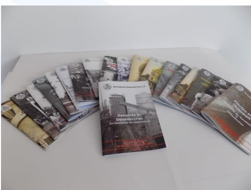
Heft „Heimatbund“ – verschiedene Auflagen