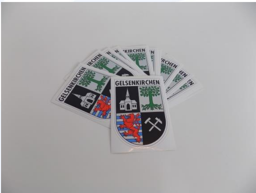
Aufkleber „Gelsenkirchen Wappen“