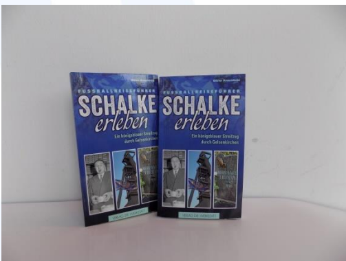
Buch „Fußballreiseführer Schalke erleben“