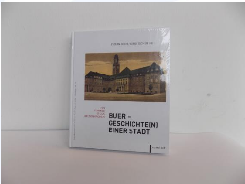
Buch „Buer - Geschichten einer Stadt“