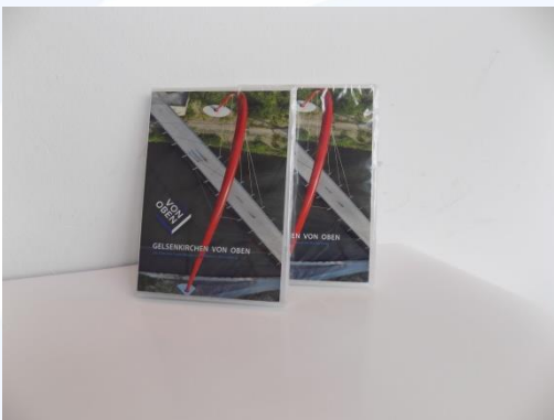
DVD „Gelsenkirchen von oben“