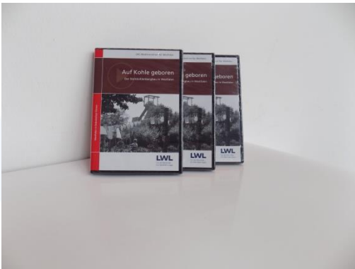
DVD „Auf Kohle geboren“