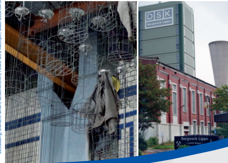
Gestaltung: brand.m GmbH, Gelsenkirchen; Fotos: Gerd Kaemper, Stadt Gelsenkirchen; Institut für Stadtgeschichte