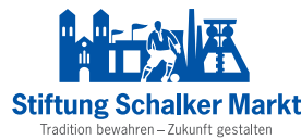
Stiftung Schalker Markt Tradition bewahren – Zukunft gestalten