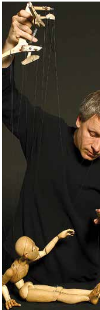
Metamorphosis Worlds of Puppets