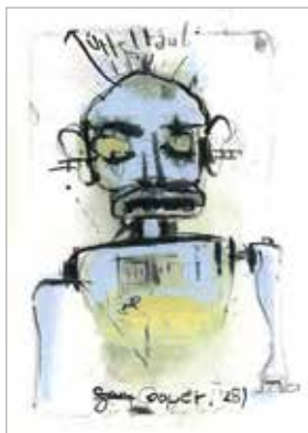
Bildkunst Bonn © Jo Scholar

Frank M. Helferich präsentiert Grafiken und Fotografien. Unter dem Titel „Du darfst“ gibt es außerdem „etwas“ zum Mitmachen.