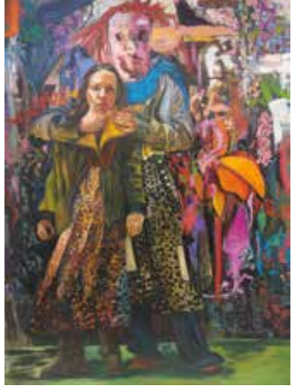
„Selbst“ © Susanne Zagorni: