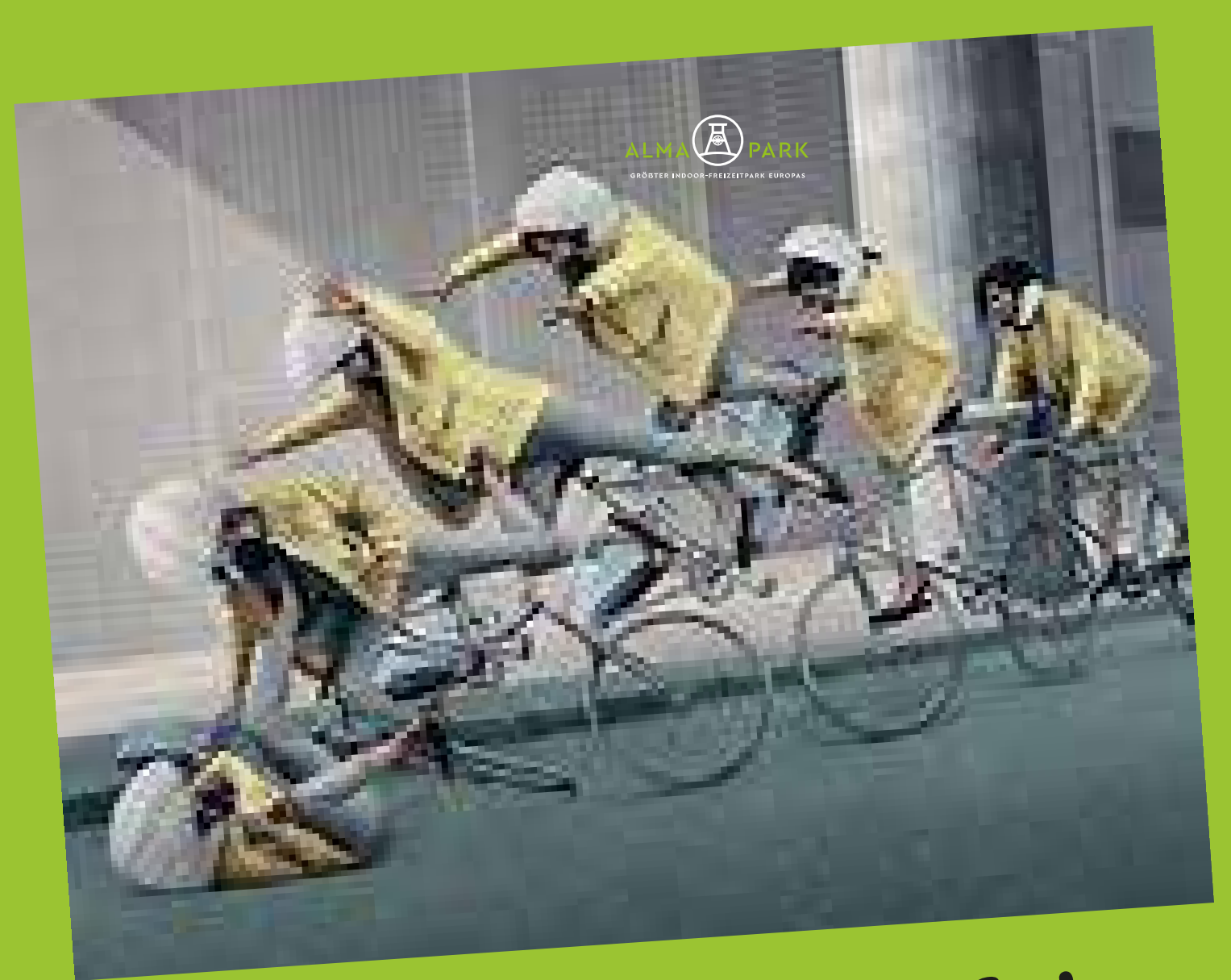
15 Uhr Hövding-Vorführung