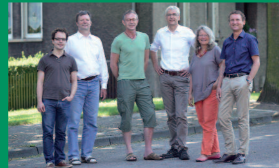
Das Team vom Stadtteilbüro