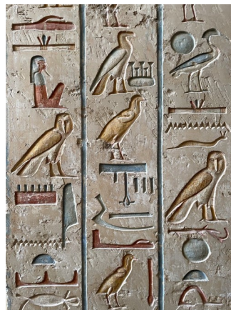
Hieroglyphen. Schriftzeichen des alten Ägypten.