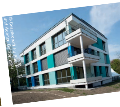
© Gesellschaft für Bauen und Wohnen Bottrop mbH