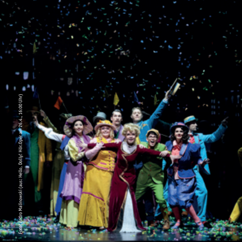
(aus: Hello, Dolly! Hör.Oper am 26.4., 16:00 Uhr)