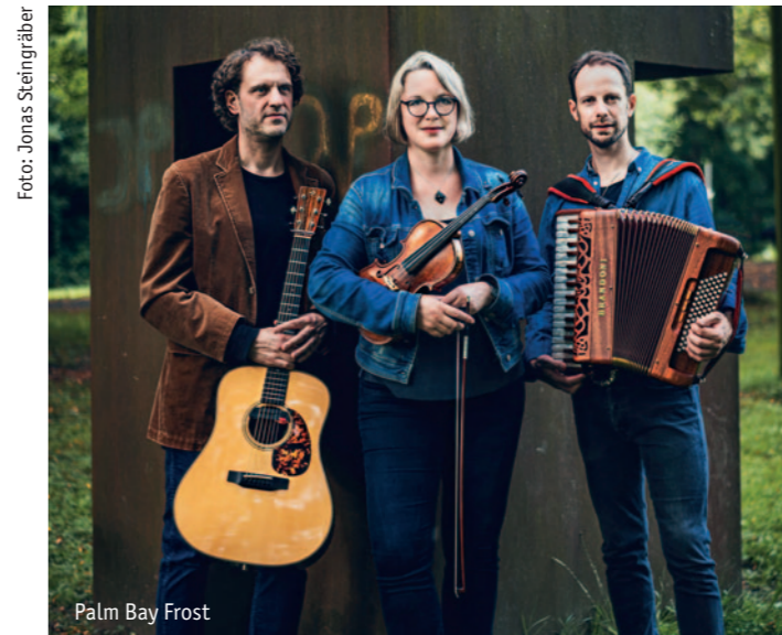
Palm Bay Frost