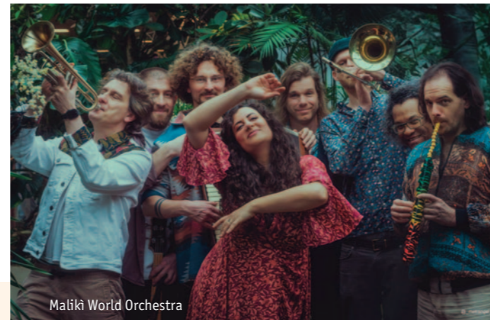
Maliki World Orchestra