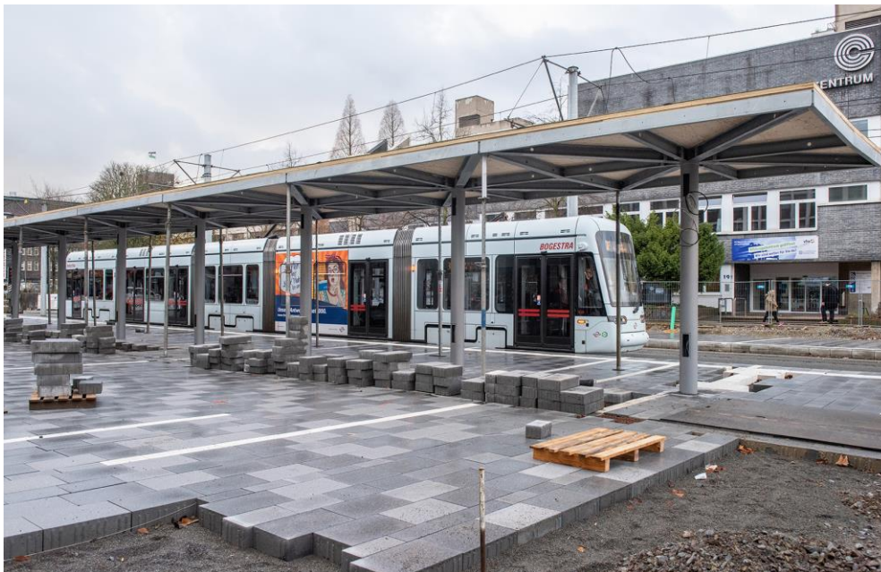
Abbildung 2: Hochbau- und Pflasterarbeiten an der Haltestelle „Musiktheater“

Die Öffnung des Treppenabgangs erfolgt aufgrund ausstehender Restarbeiten allerdings erst am Wochenende vor Weihnachten.