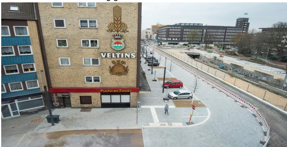
Abbildung 1: Die Ebertstraße nach der Eröffnung