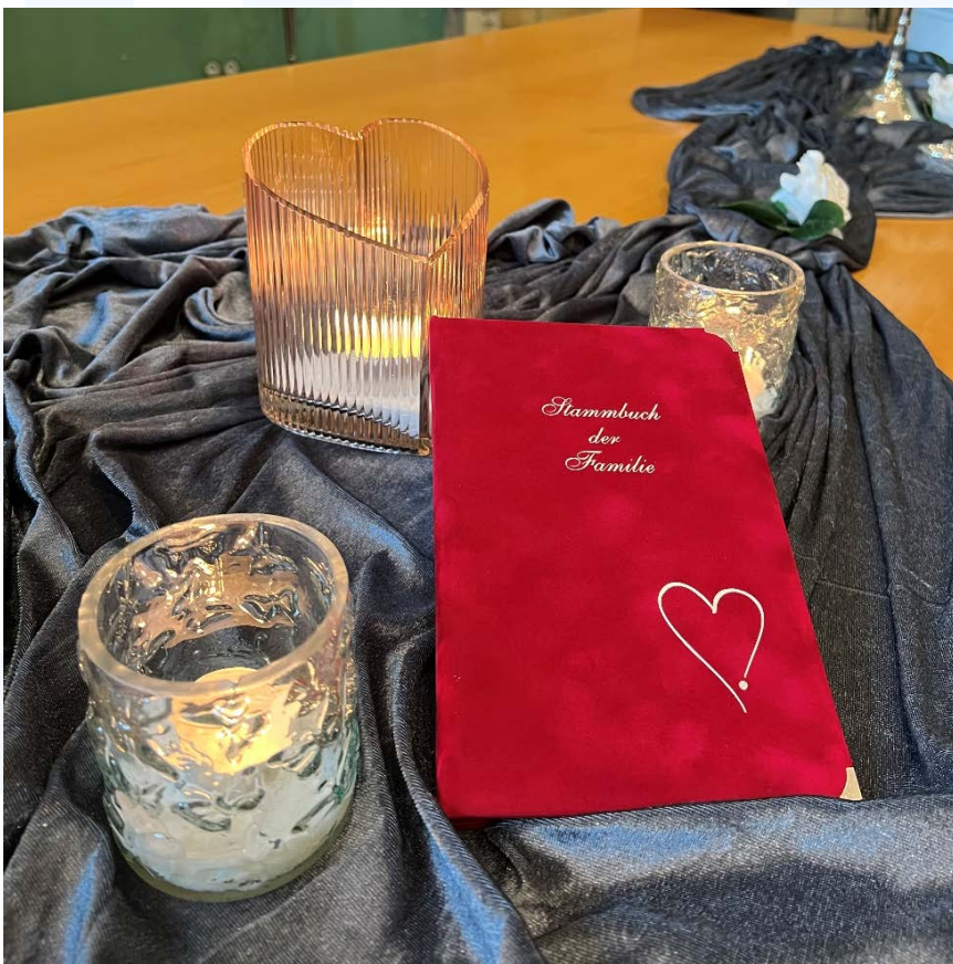
Stammbuch „Mon Amour“