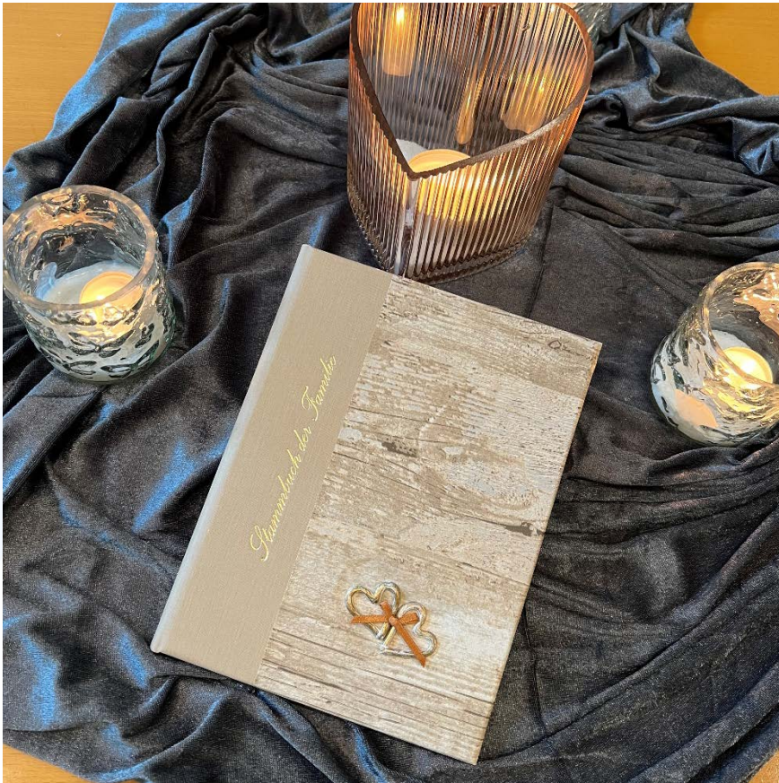
Stammbuch „Düne A5“

Stadt Gelsenkirchen, Referat 33/2 Standesamt, Turfstraße 21, 45875 Gelsenkirchen • Tel: 0209 169-6100 • E-Mail: standesamt@gelsenkirchen.de