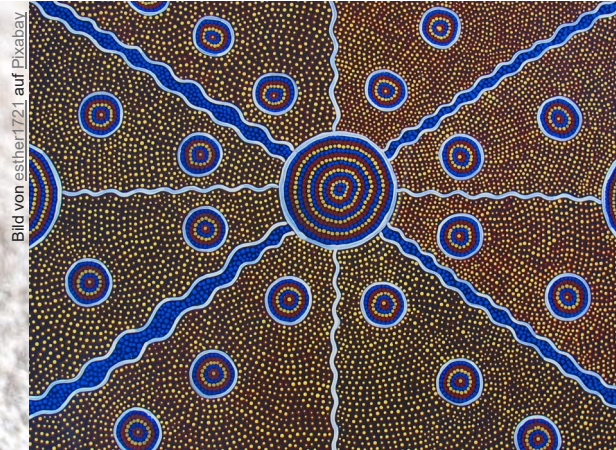
Kunstwerk der Aborigines

Link: https://klexikon.zum.de/wiki/Australien