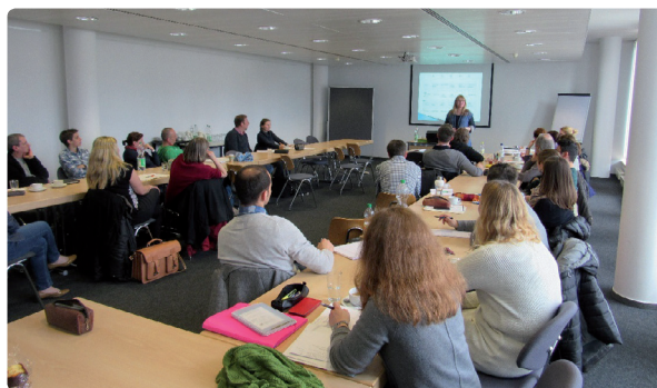
Workshop „Grammatikarbeit in Seiteneinsteigerklassen“ im Wissenschaftspark Gelsenkirchen

Des Weiteren wurde der breiten Hörerschaft die Diagnose von Fehlerquellen aufgezeigt, die häufig beim Transfer von sprachlichen Mustern aus der Muttersprache auftreten. Nicht zuletzt dienten die praxisorientierten Beispiele den Lehrerinnen und Lehrern zur Optimierung ihres täglichen Unterrichtes. Finanziert und ermöglicht wurde der Workshop durch die freundliche Unterstützung des Kommunalen Integrationszentrums Gelsenkirchen!