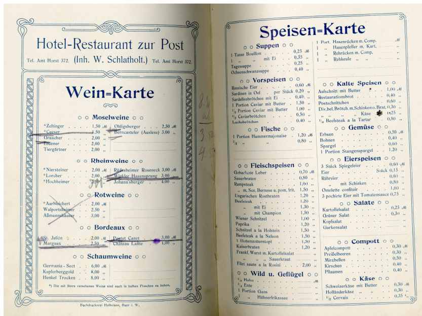
Speisekarte der Einweihungsfeier des Gymnasial- und Realschulgebäudes von 1908 12

Interessant sind auch die Lehrpläne Buerscher (Grund-)schulen, die einen Vergleich mit heutigem Lehrstoff zulassen (Bu 1830) und die monatlichen Nachweisungen über die Schulverhältnisse in den Ortsteilen mit Angaben zu den Klassengrößen und Ausgaben der einzelnen Schulen (Bu 1965 f.).