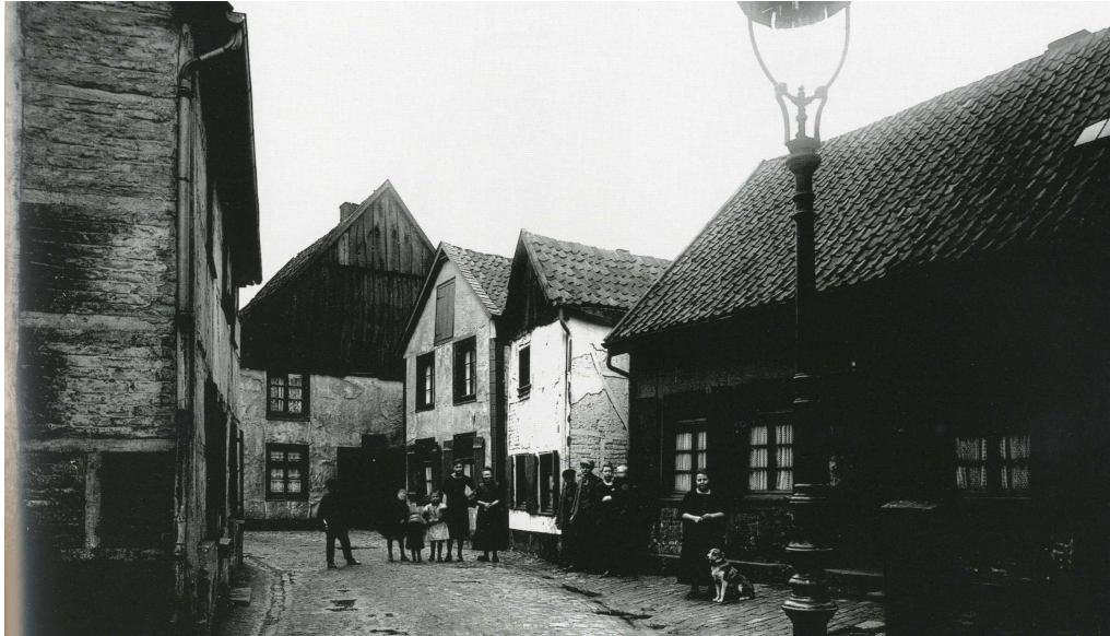
Blick in die Luciagasse Anfang der 1920er Jahre. Hier wird in eindrucksvoller Weise der dörfliche Charakter Buers verdeutlicht. 3

begann die Ruhrbesetzung durch französische und belgische Truppen, die wegen nicht erfüllter Reparationsleistungen, resultierend aus dem Versailler Vertrag, auch Buer nicht verschonten. Sie verhafteten den Oberbürgermeister Emil Zimmermann; es ließen zwei Bueraner und zwei französische Offiziere ihr Leben. Erst 1925 zogen sie sich gemäß dem Dawes-Plan aus dem Ruhrgebiet zurück.