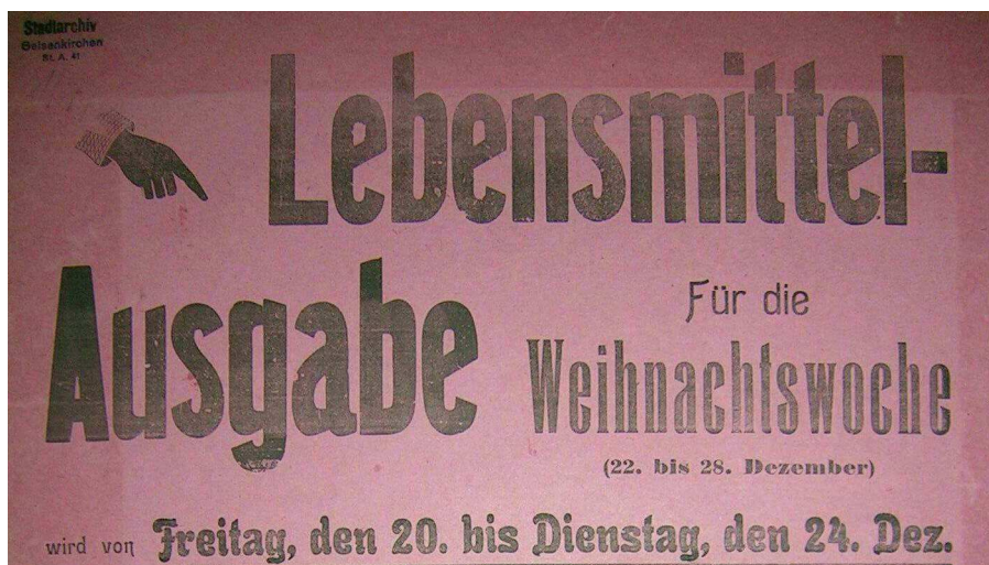
Bekanntmachung über die Lebensmittelausgabe in der Weihnachtswoche 1918 11

Ein wesentlicher Schwerpunkt der Akten bildet die Austeilung von Lebensmittel- und Warenbezugskarten durch das Fürsorgeamt als Folge des Ersten Weltkrieges. Eine 1915 eingerichtete Preisprüfungsstelle sollte Preissteigerungen bei Zucker, Käse, Butter und anderen Lebensmitteln verhindern. Ihre Sitzungsprotokolle sind unter Bu 1339 einsehbar. Um den Hunger der notleidenden Bevölkerung Anfang der 1920er Jahre zu stillen, bat der Magistrat das Reichsernährungsamt um eine Sonderzuweisung von Hülsenfrüchten und anderen „minderwertigen“ Lebensmitteln – nachzulesen unter Bu 1355.